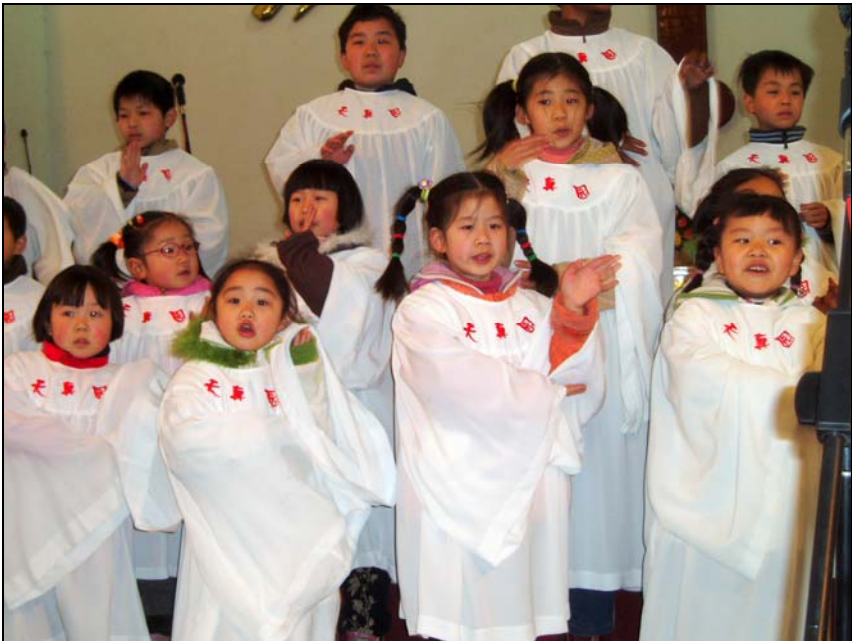
Barnkör i Tacksägelsekyrkan Wuhan, Kina